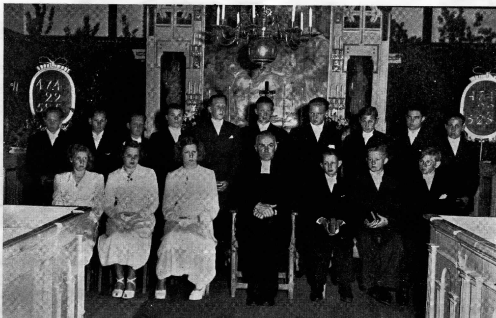
Gruppenfoto från konfir- mationen.